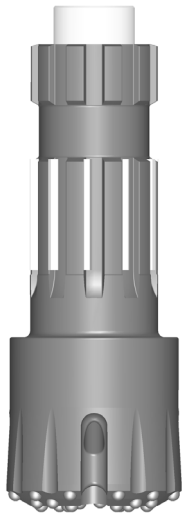
Shank de la broca RC100