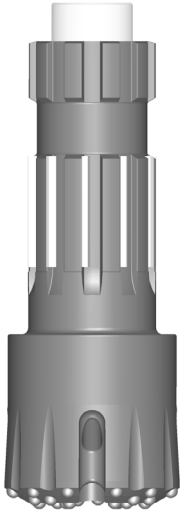
Manche de Trépa RC100