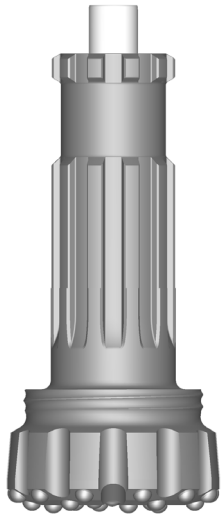
Manche de Trépa 380