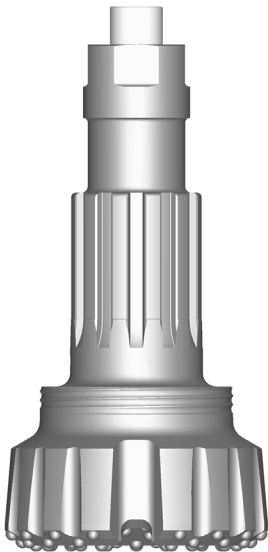
Shank de la broca P120